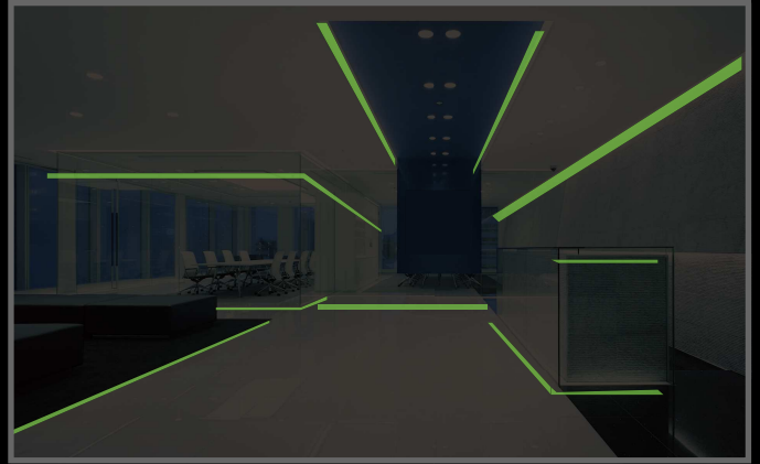
電力遮断時 (LED 消灯時)